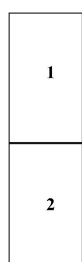
Схема расположения листов